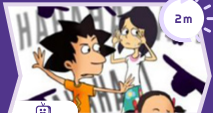
Enquête à plumes